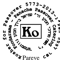
מנהל ראשי ומנהל כשרות